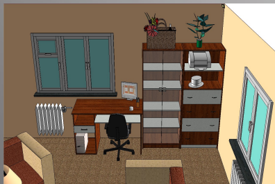
Matúš Buksár z I. DS Návrh obývacej izby v programe PRO100